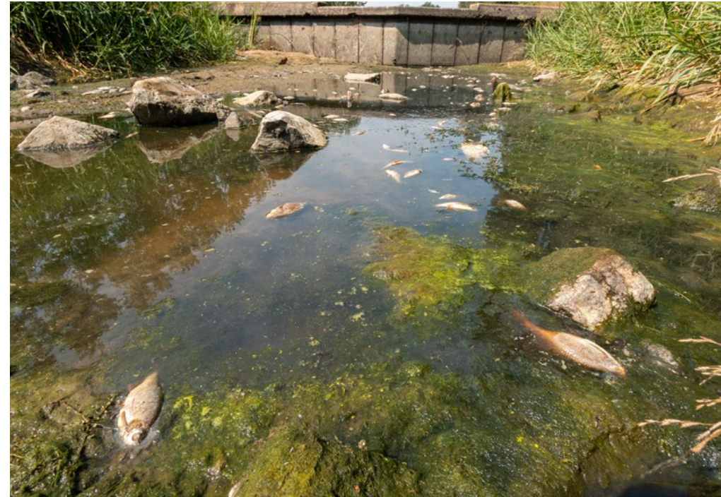
Drooggevallen beek in de Achterhoek.

D roogte, hoge watertemperaturen en een slechte waterkwaliteit ondermijnen de visstand in Nederland. Maar ook een overvloed aan water – bijvoorbeeld door stortbuien en wateroverlast – doen de vis geen goed. Na de watersnood in juli 2021 in Valkenburg belandden vissen door de hoge waterstand op straat of ze verdwaalden in de mais- en aardappelakkers langs de Maas en overstroomde beken.