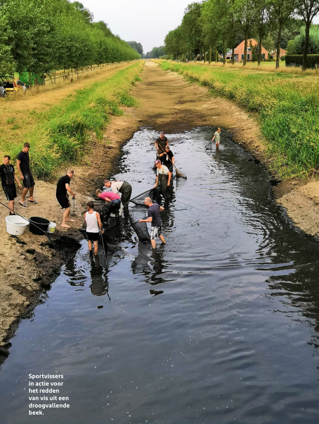
Sportvissers in actie voor het redden van vis uit een droogvallende beek.

de verdroging, maar versnelt ook de verslechtering van de waterkwaliteit (verziltning, blauwalg) en veroorzaakt verzakking en bodemdaling. Het raakt direct aan de kwaliteit en temperatuur van het water. Hoe droger het is, hoe warmer het water wordt en hoe minder zuurstof dat bevat. Hoe minder water er is, des te geconcentreerder de verontreiniging is. Het zijn allemaal ontwikkelingen die ook de visstand raken.