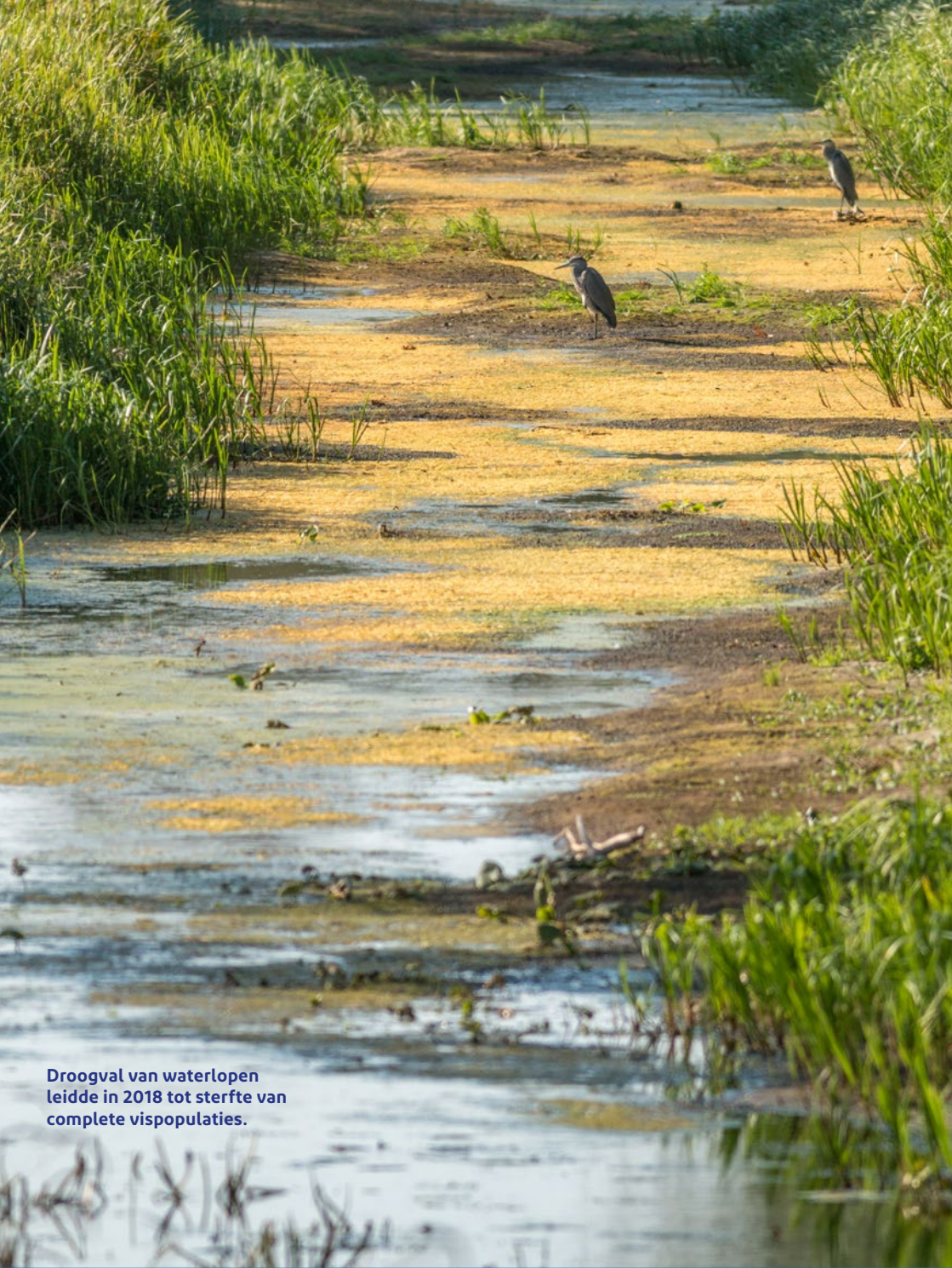
Droogval van waterlopen leidde in 2018 tot sterfte van complete vispopulaties.