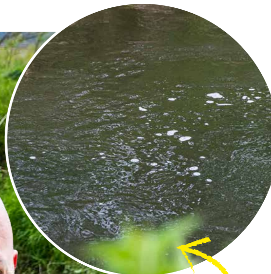
witte belletjes en schuim markeren zuurstofrijk water

OP DE LAATSTE STEK VERZILVERT RUBEN EEN MOOIE AANBEET EN BARST DE STRIJD LOS