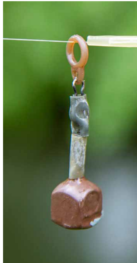
Een vrij schuivend gewichtje van een gram of tien is vaak al voldoende om in ondiep, stromend water het aas mooi te presenteren.

door de stroming wordt meegevoerd. Insecten, kikkers en zelfs kleine visjes; ze eten werkelijk alles. Zie je trouwens ook die witte belletjes op het water? Dat is een teken van zuurstofrijk water, dus daar zit je qua stekkeuze ook altijd goed.”