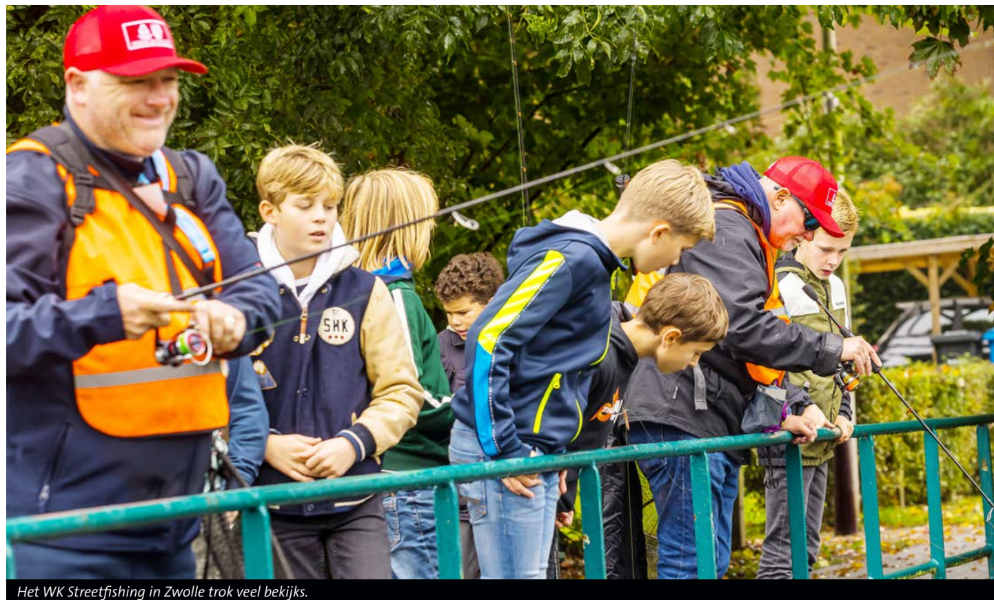
Het WK Streetfishing in Zwolle trok veel bekijks.