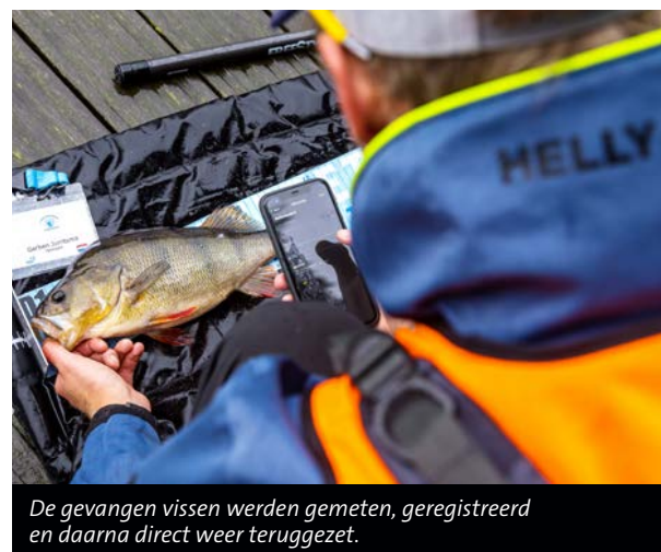
De gevangen vissen werden gemeten, geregistreerd en daarna direct weer teruggezet.

gespeeld geraakt. “Als we op een stek aankomen weten we al wie waar gaat werpen en welk deel gaat afvissen. Dat maakt dat je bijzonder effectief te werk kunt gaan.”