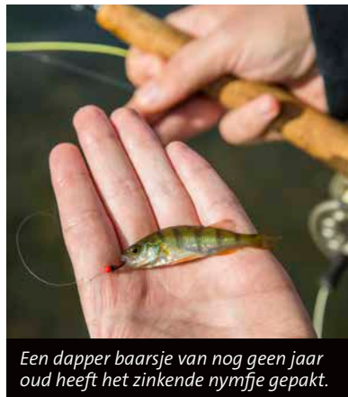
Een dapper baarsje van nog geen jaar oud heeft het zinkende nymfje gepakt.