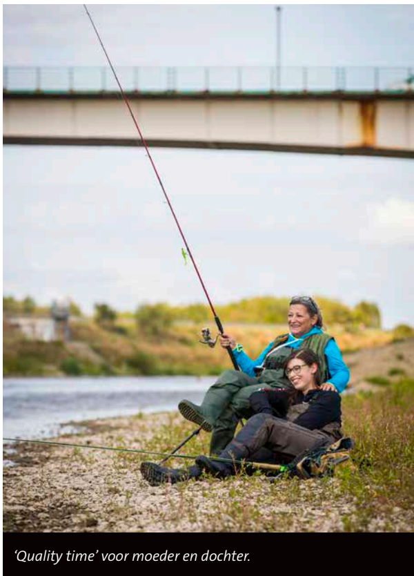
'Quality time' voor moeder en dochter.